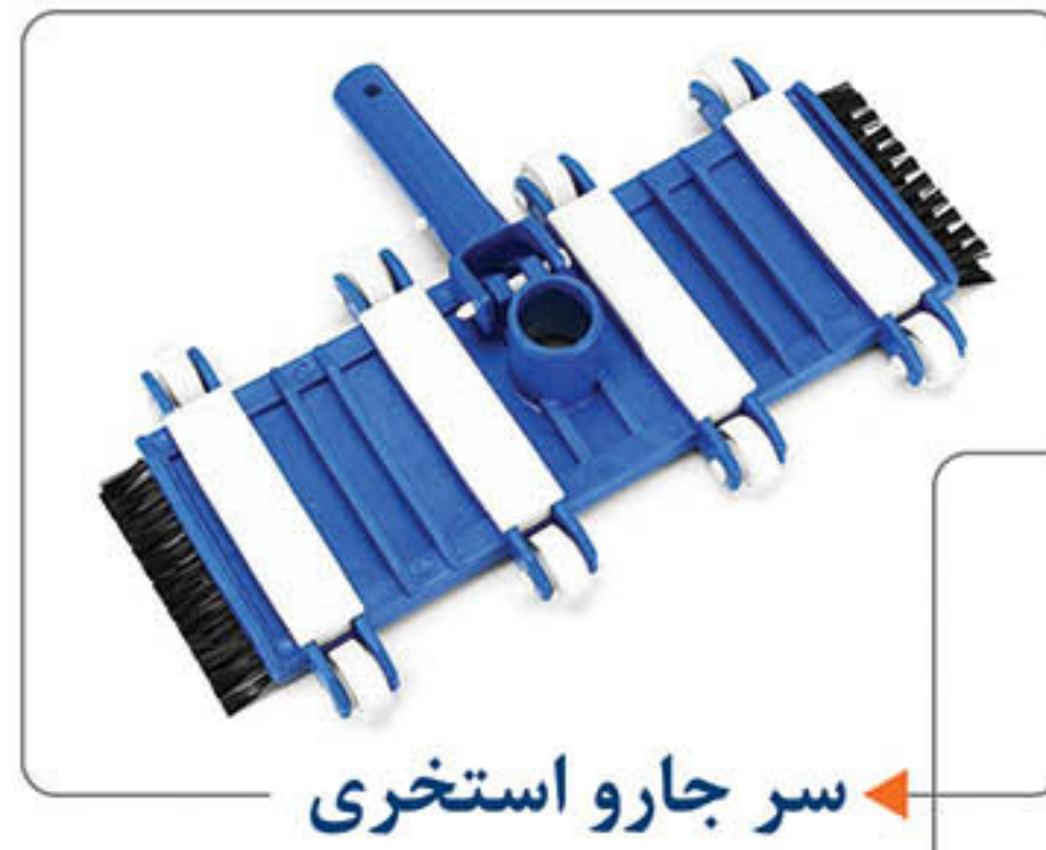
سر جارو استخری ←