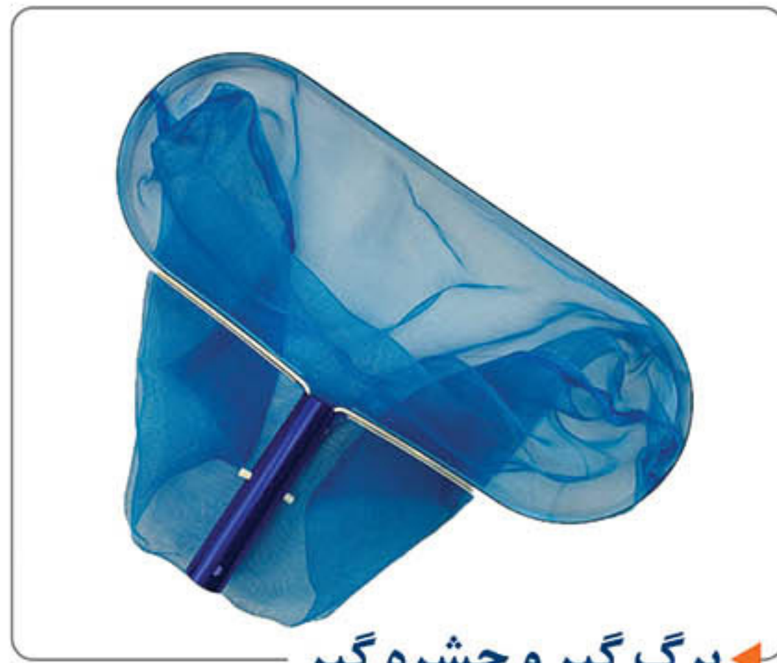
برگ گیر و حشره گیر ←