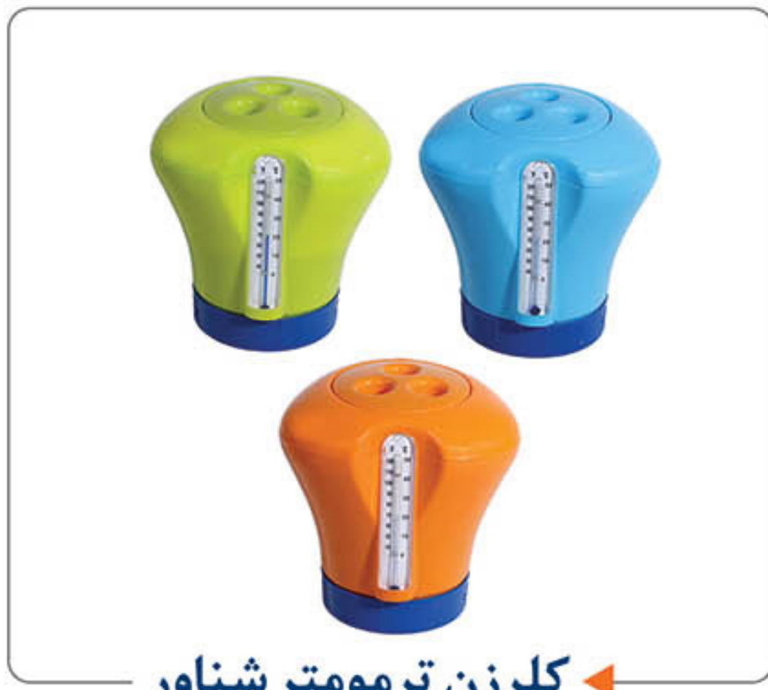
کلرزن ترمومتر شناور ←