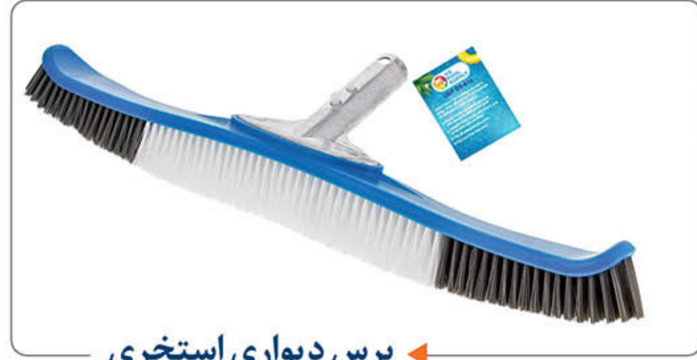
برس دیواری استخری ←