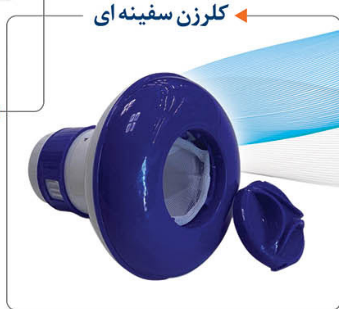
کلرزن سفینه ای ←